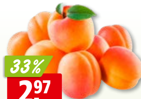
Aprikosen A aus Spanien, 5 kg