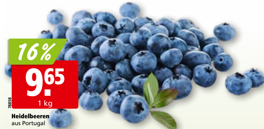
Heidelbeeren aus Portugal