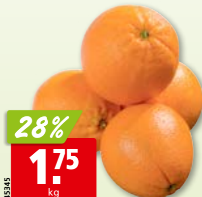
Orangen aus Portugal, 10 kg