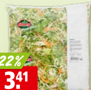
Salat Evasion hergestellt in der Schweiz