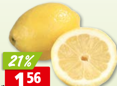
Zitronen aus Portugal, 6 kg