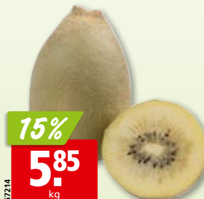
Kiwis Gold aus Neuseeland, ca. 5.7 kg