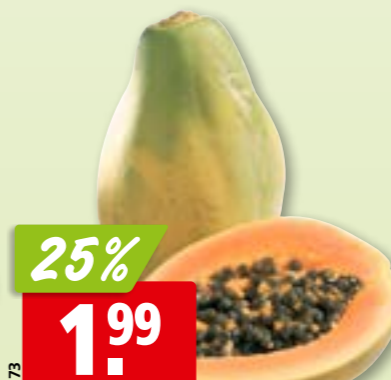
Papaya aus Brasilien, 9 x