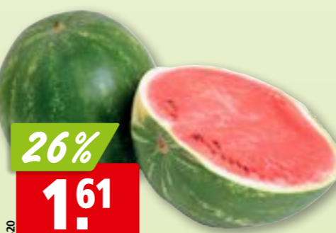
Wassermelone aus Marokko, ca. 10 kg