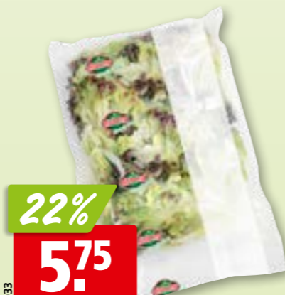
Lollo Rosso hergestellt in der Schweiz