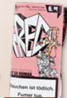
Al Capone Sweets Filter 5 x