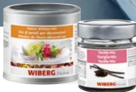
Dekor-Blüten-Mix Flower Power für die Sinne