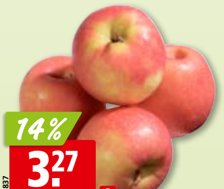
Äpfel Pink Lady I aus der Schweiz, ca. 6.5 kg